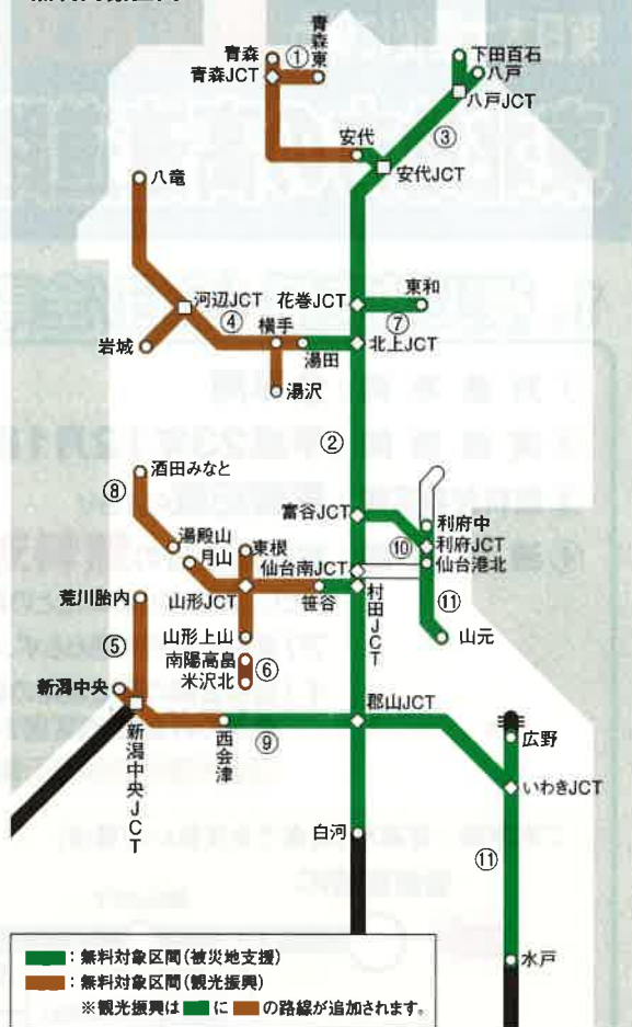
東北地方の高速道路の無料対象区間